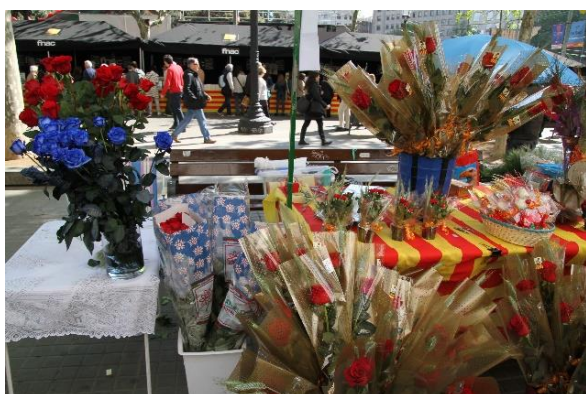
Празднование Святого Георгия в Барселоне

Поскольку в 1995 году ЮНЕСКО провозгласила 23 апреля как Международный День Книги , которое совпало с Днём празднования Святого Георгия, в некоторых регионах, таких как Балеарские острова и Каталония, существует популярная традиция, которая сочетает в себе обе эти даты преподнесением красных роз (Святого Георгия) и подарками книг (День Книги), а также праздничными презентациями новинок литературы и поэзии.