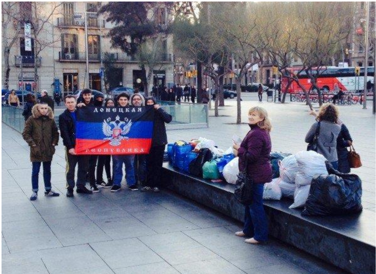
Plaza de la Universidad (Barcelona)

http://vksrs.com/publications/rossiya-i-sootechestvenniki-pomogayut-donbassu-chuzhikh-detey-ne-byvaet/