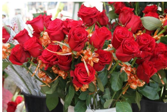
Celebración de San Jordi en Barcelona

Debido a que en 1995 la UNESCO proclamó el 23 de abril como Día Mundial del Libro , coincidiendo con el día de la conmemoración del santo, en regiones como Cataluña y Baleares, existe una tradición popular que aúna ambas conmemoraciones mediante los intercambios de regalos de rosas (San Jorge) y libros (Día del Libro).