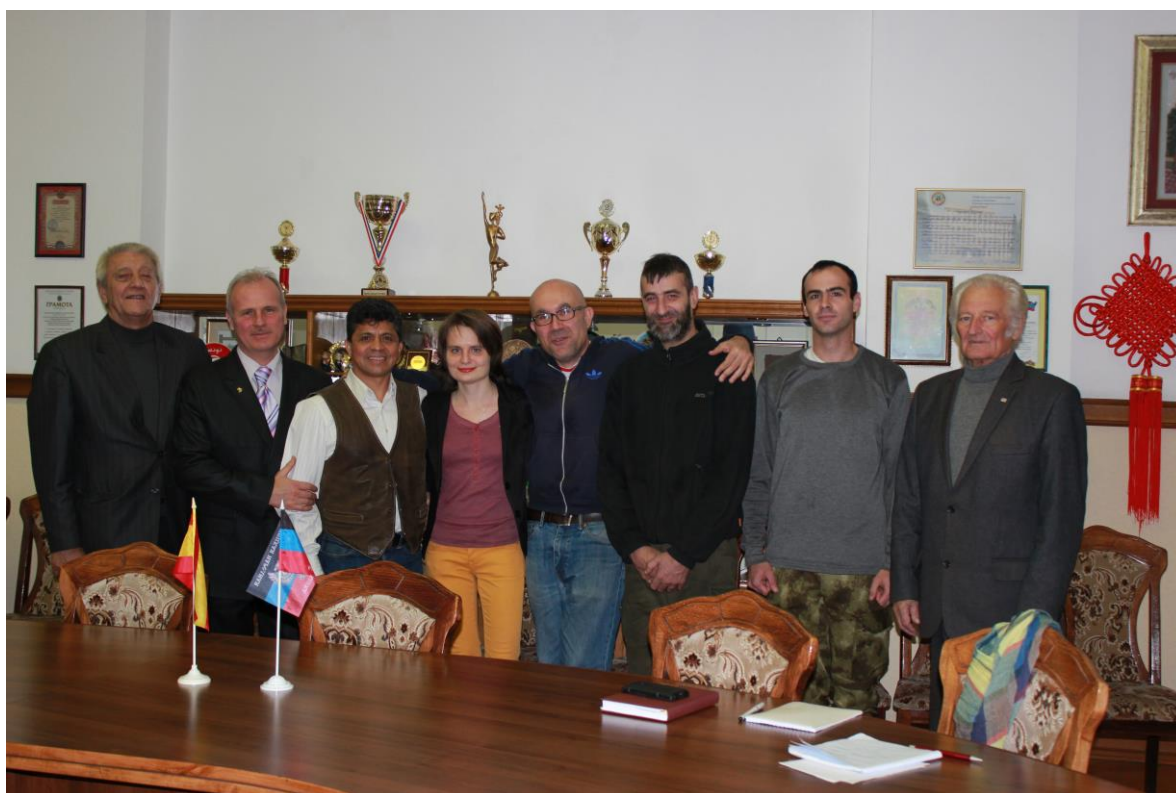
На фото памятная встреча учреждения Русско-Испанского Центра им. Мигеля Сервантеса де Сааведра (далее «Центр»)

Más información acerca de todos los logros le informará la nuestra revista.