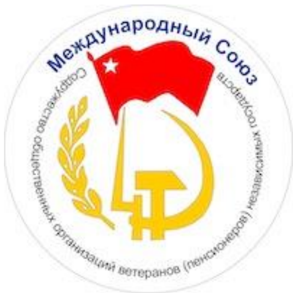
Герб Международного Союза «Наследники Победы»

В январе 2016 года ДонНТУ получил приглашение вступить в ряды Союза «Наследники Победы». И на первом заседании Ученого Совета ДонНТУ единогласно было проголосовано за участие в этой авторитетной организации. Что это за Союз? По сути – это Союз всех тех, кто считает себя наследником Большого Русского Мира.