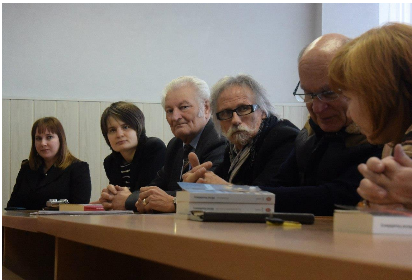
Встреча представителей ДонНТУ и ДонНУ с французской делегацией.