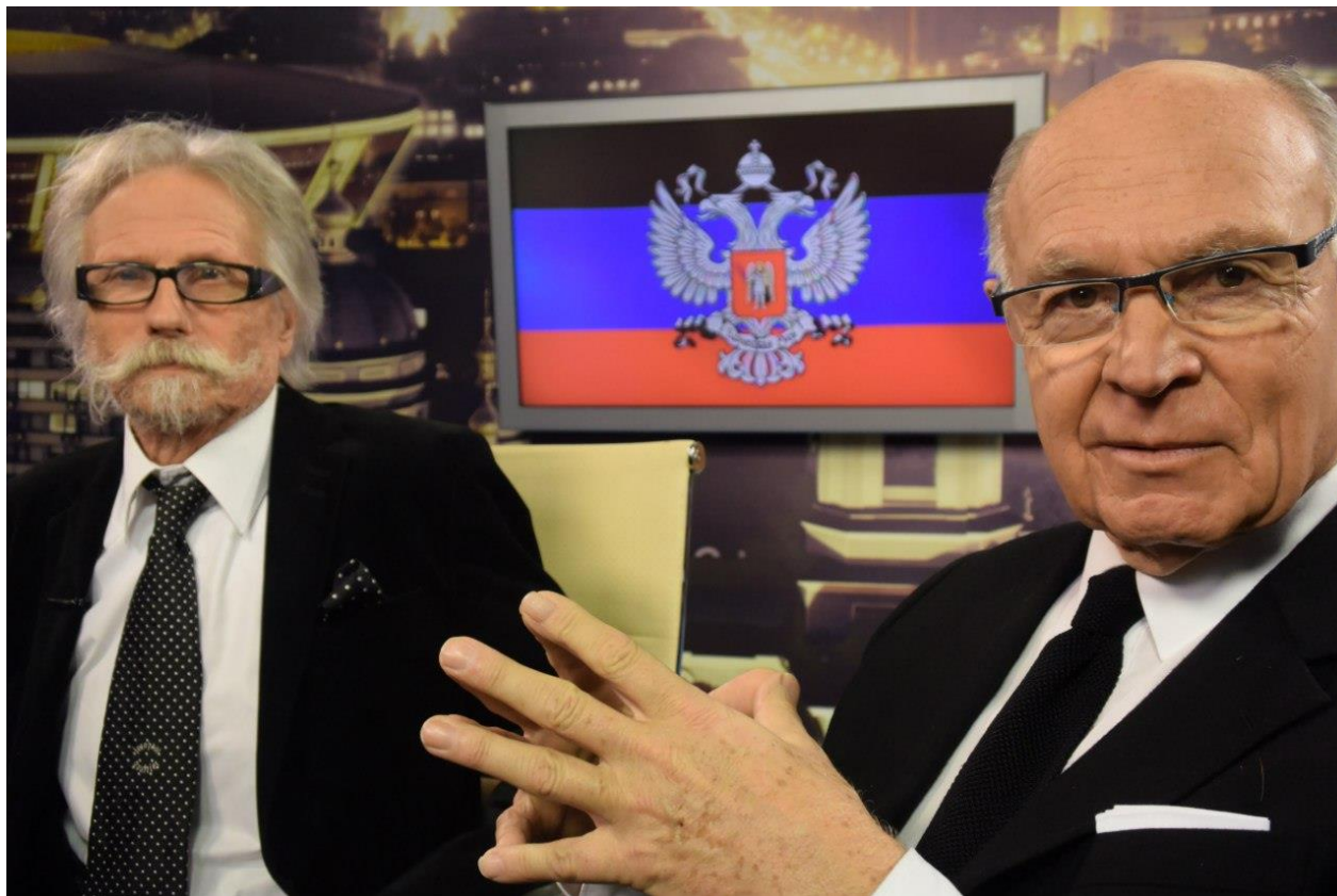
Жози-Жан БУСКЕ (слева) и Жак КЛОСТЕРМАНН (справа)

11 января 2016 г. французская делегация в рамках частного визита прибыла в Донецкую Народную Республику. В составе делегации были Жак КЛОСТЕРМАНН, Жози-Жан БУСКЕ и его жена Ханан МАСХУД.