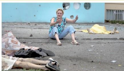
Victimes civiles des bombardements

communiquer avec l'extérieur, faute de service postal. D'où l'idée de monter cette mission d'observation à titre privé dans le Donbass avec Me Jean-Josy Bousquet, ancien bâtonnier de Béziers et avocat de la Ligue des Droits de l'Homme ainsi que son épouse ». Après une journée intense où ils furent conduits dans les ruines du Donbass et au contact des victimes civiles des bombardements de l'Armée ukrainienne (armée par les Américains), la délégation a rencontré, au cours de plusieurs journées très chargées, parfois sous les bombes, les autorités du Donbass, dont le commandant de la résistance Edouard Bassourine, qui a produit une forte impression sur Jacques Clostermann. Et même un