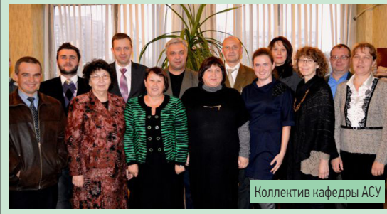
Коллектив кафедры АСУ

«Уважаемые коллеги, поздравляю вас с 44-летием кафедры «Автоматизированные системы управления». Поздравляю всех, кто вложил душу и сердце в ее формирование, развитие и процветание. Желаю, чтобы ваша квалификация всегда находилась на высоком уровне, здоровье позволяло реализовывать все ваши замыслы, а заработная плата – не задумываться о финансовых вопросах!»