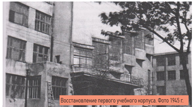
Восстановление первого учебного корпуса. Фото 1945 г.

Материальные потери Донецкого индустриального института были ужасающими. Из 16 учебных и жилых корпусов ДИИ 14 были сожжены или взорваны. Фундаментальная библиотека, насчитывавшая в 1941 г. более полумиллиона томов, практически полностью была уничтожена. В развалины был превращен