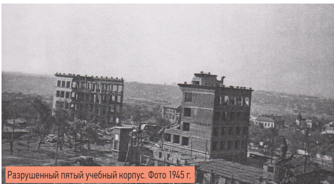
Разрушенный пятый учебный корпус. Фото 1945 г.

Стиль и орфография авторов воспоминаний переданы без изменений.