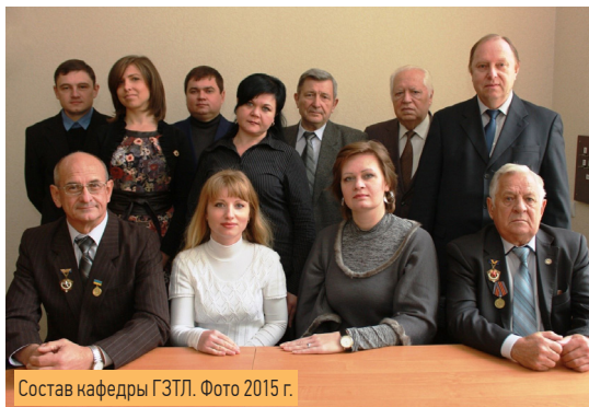
Состав кафедры ГЗПЛ. Фото 2015 г.

в промышленности, торговле и строительстве. Полученные знания в области инженерной механики, логистики и компьютерного проектирования позволяют им работать на инженерных и руководящих должностях в организациях, на предприятиях и фирмах, занимающихся проектированием, изготовлением, поставками, монтажом, эксплуатацией и ремонтом оборудования систем транспортирования и складирования всех видов грузов, гражданского и дорожного строительства.